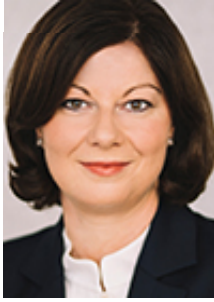
Nicole Steingaß Staatssekretärin Landesbeauftragte für den Wiederaufbau